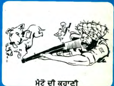
ਮੈਂਟੋ ਦੀ ਕਹਾਣੀ