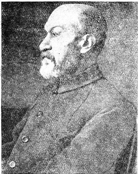
Рис. 8. Василий Владимирович Бартольд.

Целью поездки было «в дополнение к письменным известиям о прошлом страны 63 собрать на месте сведения о следах, оставленных прежними обитателями ее», по возможности дать краткое описание развалин городов, укреплений и т. п.