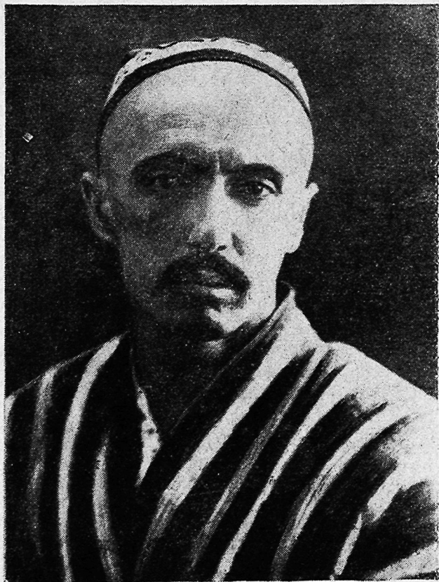
Хамза Хаким-заде Ниязи.

Прекрасный знаток и ценитель музыки, вдумчивый ученый-музыковед, он оказал большое плодотворное влияние на развитие всей узбекской советской музыкальной культуры.