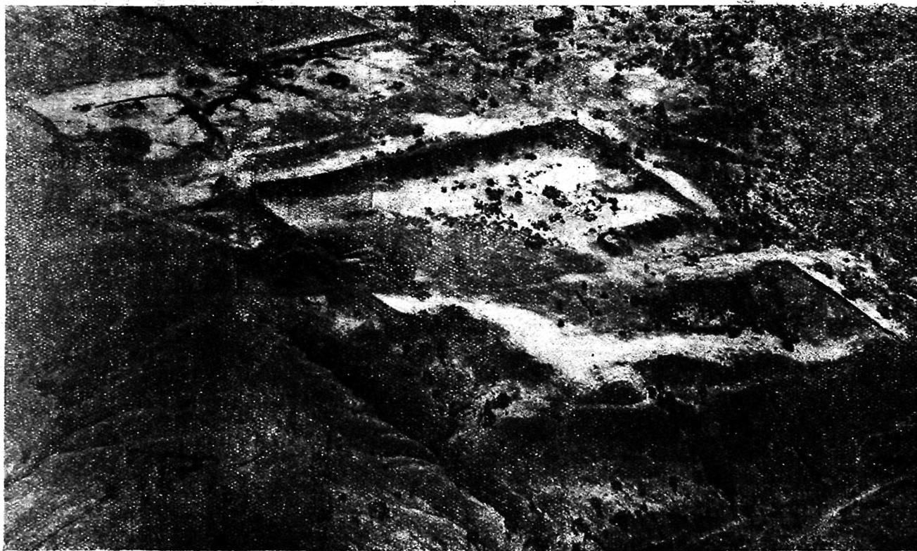
Рис. 1 Городище Ток-кала (аэрофото).