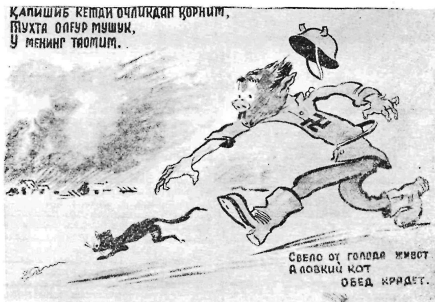
Агитплакат художника Г. Н. Карлова. Светокопия. 58×65 см. Август 1941 г.