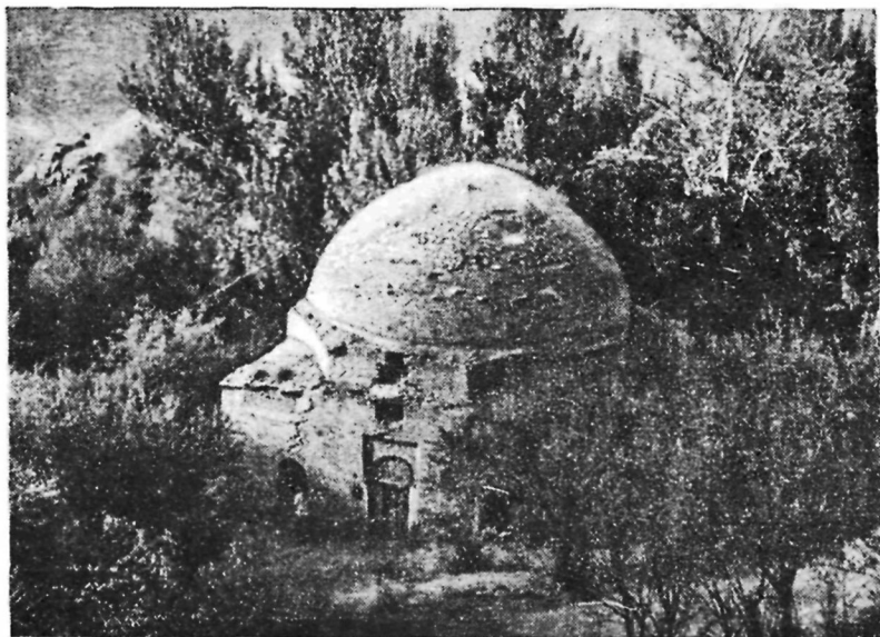
Мечеть Мир Саид Халиля в Багимазаре.

зарсай. Вокруг мечети в густых лесных насаждениях по берегам сая расположено старинное кладбище с многочисленными мраморными надгробиями 3 .