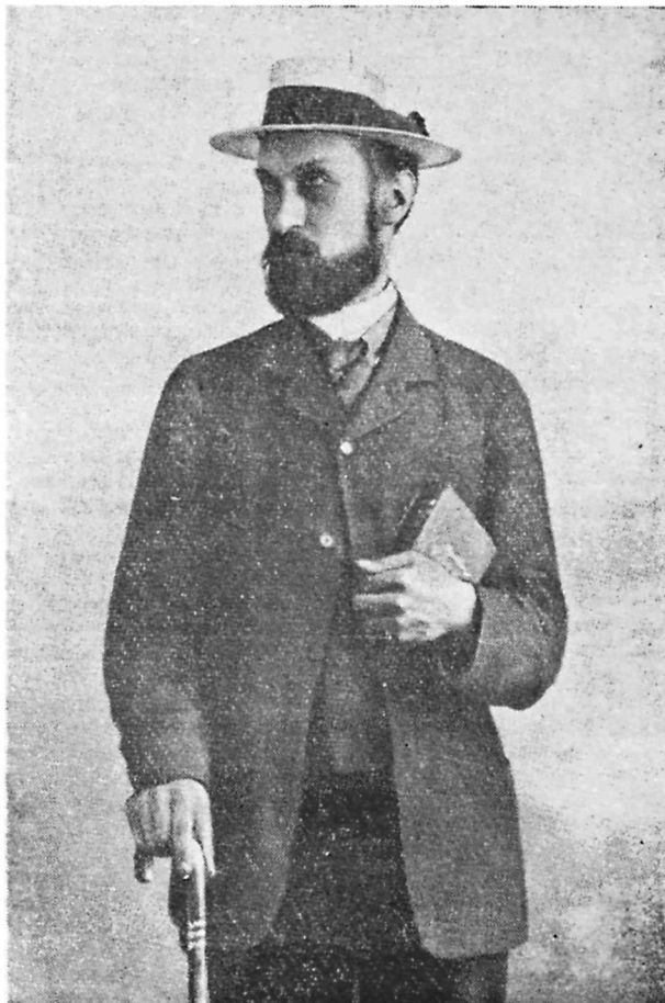
Василий Владимирович Бартольд. 90-е годы XIX в.

ной ненавистью к пришельцам, приносившим с собой господство чужого народа, чужой веры и культуры».