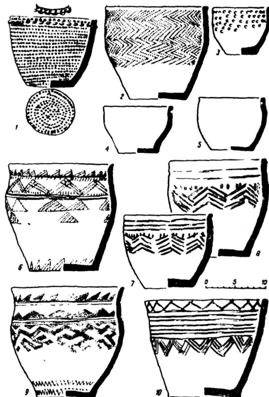
Рис. 2. Глиняные сосуды из могильников близ сел. Батени.

1—Ярки III (могила 3); 2—5—Ярки I; 6—10—Ярки II.