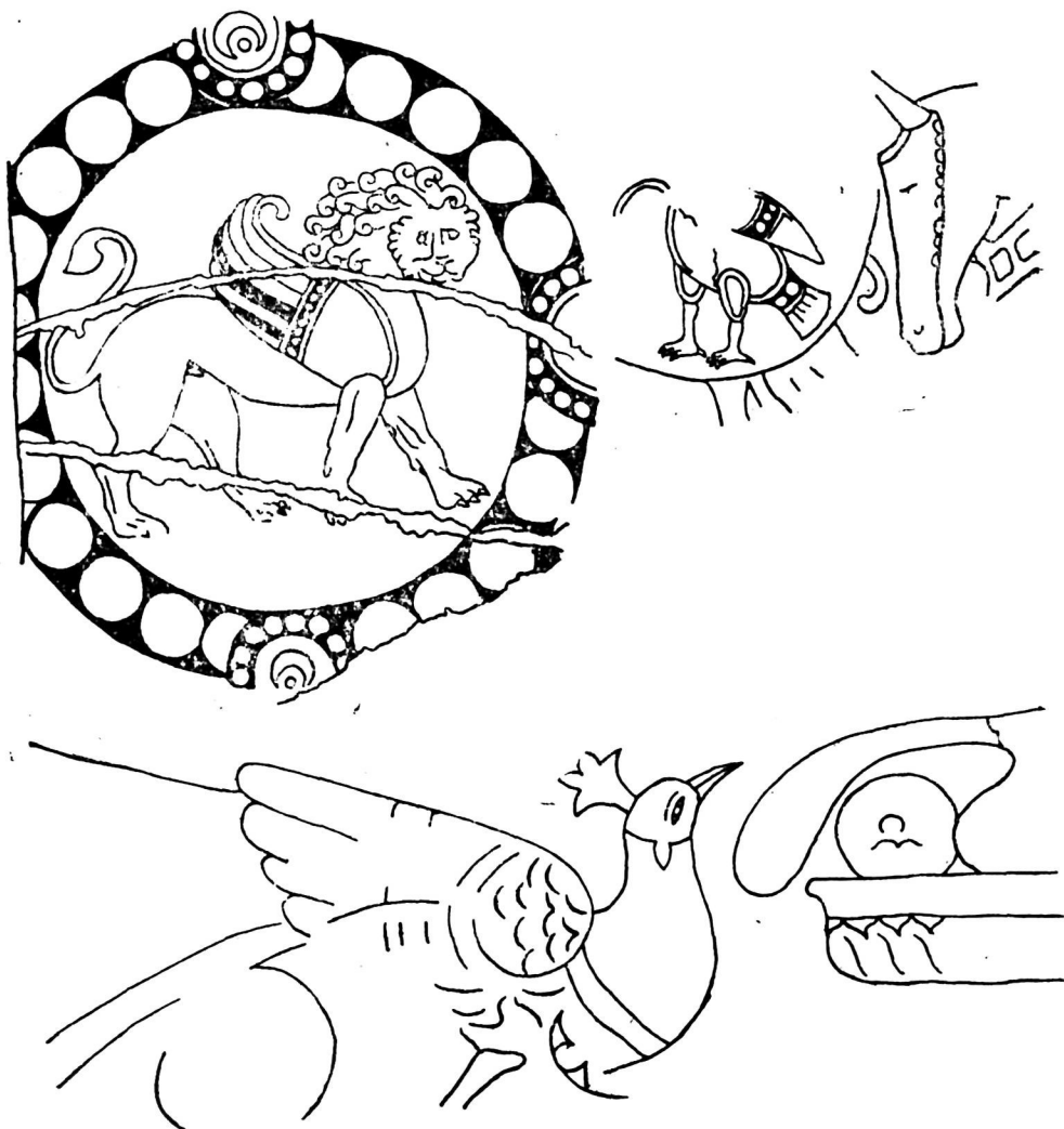
Фрагменты стеной росписей из Афрасиаба.

Подобные находки не новы для Афрасиаба: фрагменты стеной росписи попадались и раньше; однажды был вскрыт солидный кусок росписи с изображением человека в стиле VII—VIII вв. Однако из-за