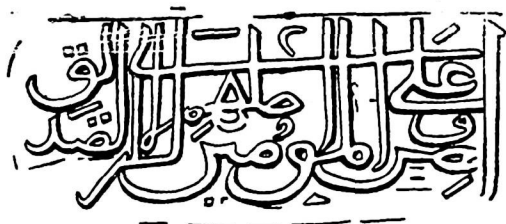
Надпись на доске из кишлака Сокан.

Старинная деревянная резьба мазара Лянгар в ферганском кишлаке Чор-Кух, судя по проходящей под потолком деревянной же резной