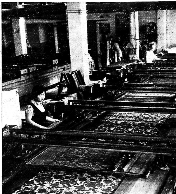
В цехе Ташкентского текстильного комбината.

Экономическая реформа, научно-технический прогресс, рост творческой активности рабочего класса, неуклонно расширяющего все формы социалистического соревнования, обеспечили последовательное повышение производительности труда. За 1959—1965 гг. она выросла (в расчете на 1 работающего) на 28%, а за 1966—1970 гг.—на 31,3% 35 .