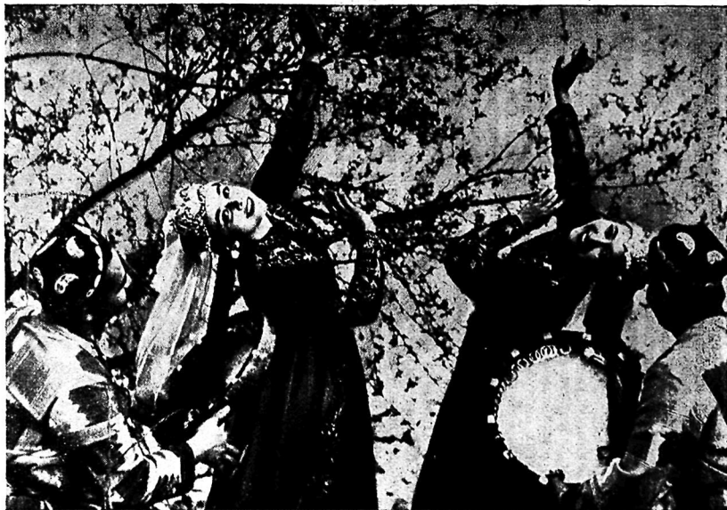
Танец „Бахор“ в исполнении ансамбля „Бахор“.