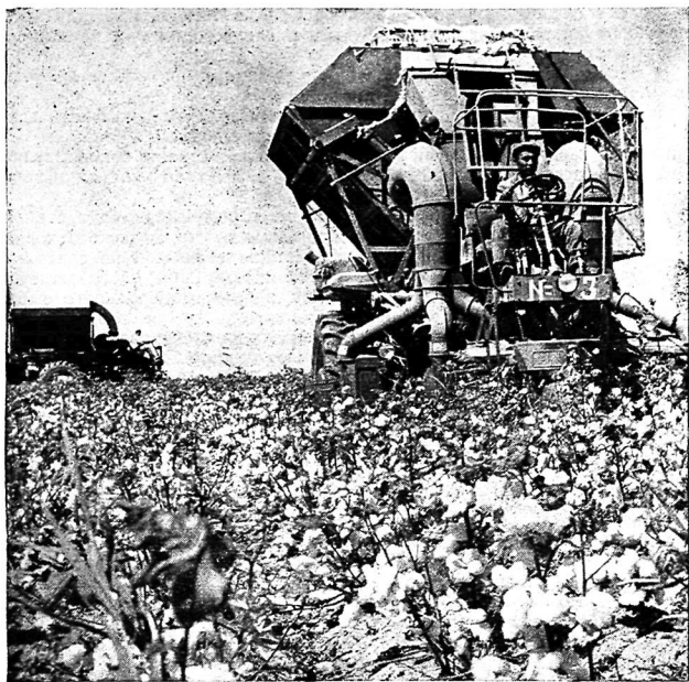
Хлопкоуборочные машины на полях Узбекистана.

С тех пор прошло более 50 лет. Начав с претворения в жизнь подписанного В. И. Лениным в 1918 г. декрета «Об организации оросительных работ в Туркестане», мы в настоящее время имеем в одной лишь Узбекской республике действующие водохранилища общим объемом свыше 3600 млн. м 3 воды и 142 тыс. км оросительной сети. Узбекская республика занимает одно из ведущих мест в мире по уровню развития поливного земледелия.