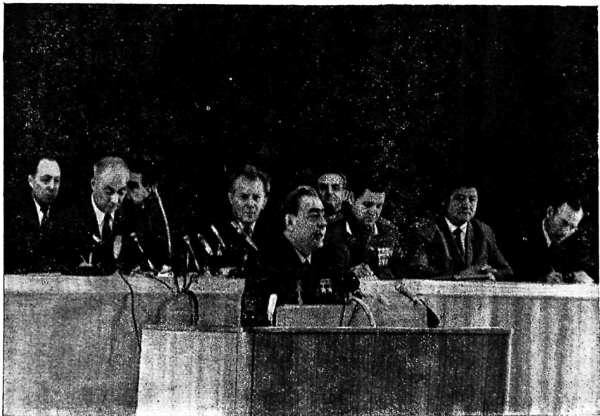
В Президиуме Ташкентского собрания партийно-хозяйственного актива хлопкосеющих республик СССР. На трибуне—Генеральный секретарь ЦК КПСС Л. И. Брежнев.