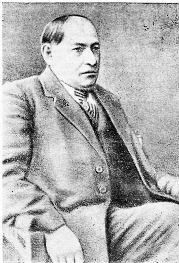
Н. Н. Нариманов.

мунистической партии и Советского государства Наримана Наджаф-оглы Нариманова (1871—1925). Он был не только крупным партийным и государственным деятелем, но и талантливым писателем, драматургом.