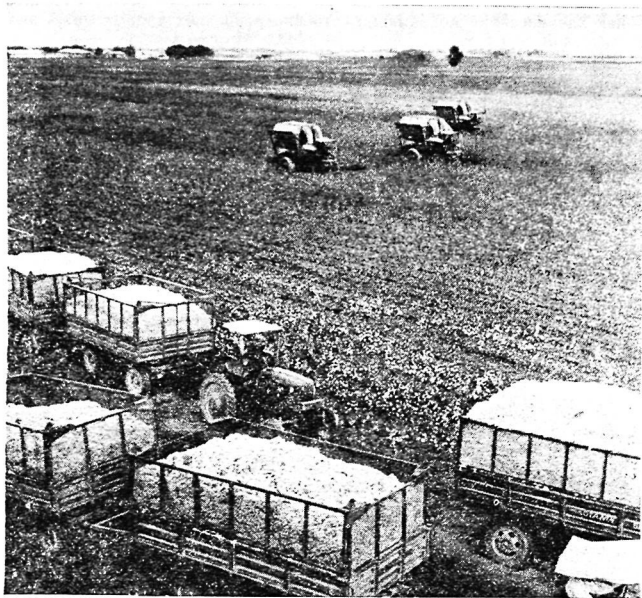
Машинный сбор хлопка.

Ныне важнейшая задача в области хлопководства — широкое развитие машинной уборки урожая, которая поглощает почти 40—50% труда, затрачиваемого на его производство. Еще в 1966 г. сбор хлопка был механизирован всего на 31%, а в 1973 г. машинами было убрано почти 2,7 млн. т сырья, или 55% урожая. Средняя выработка на одну хлопкоуборочную машину составила 98,4 т. Это позволило сократить период уборки примерно до 55 дней, вместо 80—100 дней.