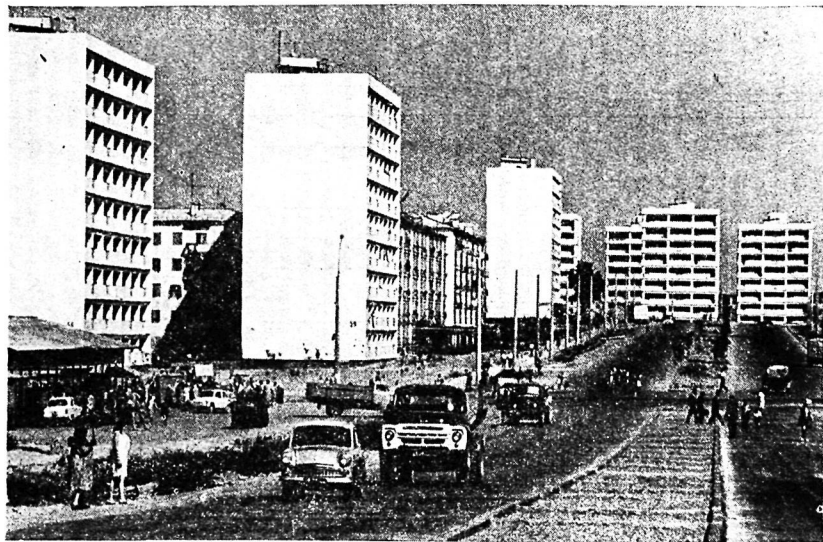
Ташкент. Квартал массива Чиланзар, возведенный строителями из Российской Федерации.