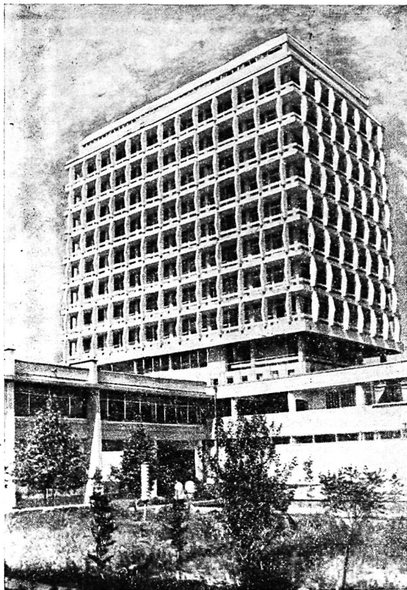
Ташкентский государственный университет им. В. И. Ленина. Главный учебно административный корпус.