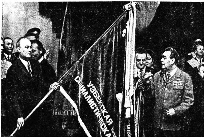
Вручение Узбекской ССР ордена Дружбы народов.