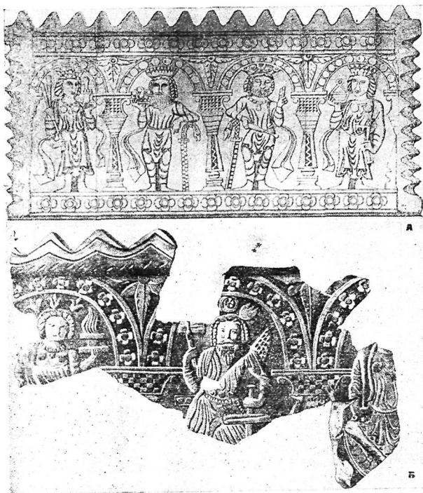
Рис. 2. Реконструкции лицевых стенок оссуариев из Бия-Наймана, выполненные по фрагментам Б. Н. Касгальским (А) и Л. И. Ремпелем (Б).

рошо известны, как характерные для согдийского чекана VI—VII вв. 7 ; с этой датировкой в полной мере согласуются и иконографические особенности рельефов.