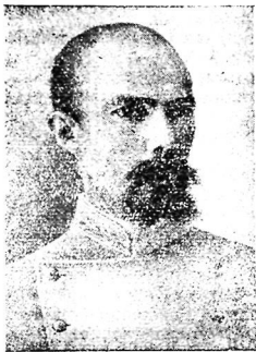
Н. Г. Маллицкий.

В Ташкенте Н. Г. Маллицкий ревностно взялся за изучение узбекского и таджикского языков. Этими языками он занимался всю жизнь, благодаря чему впоследствии свободно читал лекции на таджикском языке в Таджикском педагогическом институте и вел на узбекском языке занятия в Среднеазиатском государственном университете.