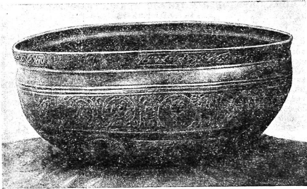
Рис. 1. Бронзовая чаша из Термезского музея.

Все элементы декора скомпонованы в определенной зависимости от полусферической формы чаши.