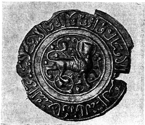
Рис. 3. Бронзовая пластина с изображением сфинкса. XII в. Термезский музей.

Специалисты считают, что примерно с середины XI в. сфинкс становится одним из популярных мотивов в искусстве Переднего Востока 18 . Возможно, что в конце XI — начале XII в. он был уже излюбленным мотивом среднеазиатской торевтики 19 . Во всяком случае, на среднеазиатских бронзовых изделиях XII—XIII вв. сфинкс встречается чаще других полиморфных образов. В XV—XVI вв. изображения его на изделиях художественного металла Ближнего и Среднего Востока отсутствуют 20 . Э. Байер считает, что прототип исламского сфинкса восходит к ахеменидским образцам 21 .