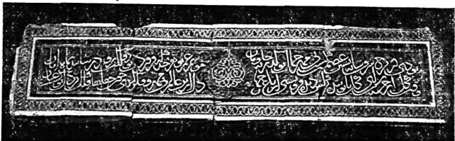
Рис. 1. Общий вид облицовки длинной стороны надгробия с Каджартепа.

В 1967 г. в юго-западном углу городища Каджартепа (или Гулистантепа), в местности Бешкент Кашкадарьинской области УзССР, была обнаружена кирпичная кладка с керамической облицовкой 1 .