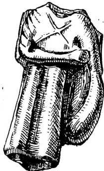
Рис. 3. Статуэтка мужчины.

античной Средней Азии, в том числе Бактрии. Свообразны положение рук, костюмы, атрибуты. Однако их объединяет общая композиция, продиктованная временем. Статуэтки выполнены строго по канону фронтальности. Пропорции фигур построены симметрично, скважины и неподвижны, что свойственно изображениям, несущим иератический характер. Сейчас трудно объяснить, чем вызвано кардинальное отличие мирзакултепских статуэток от известных нам среднеазиатских — этническими особенностями или религиозными воззрениями. Отсутствие голов у всех фигурок еще более усложняет разрешение этого вопроса. Тем не менее они представляют огромный интерес для истории изобразительного искусства; благодаря им стали известны новые образы чтимых божеств с соответствующими религиозными воззрениями, символами и эстетическими взглядами.