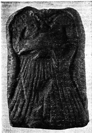
Рис. 1. Статуэтка богини из Мирзакултепа.

ного ангоба. Оттиск объемный, выполнен штампом. Голова утрачена. Длина статуэтки 125 мм, ширина 48—74 мм, толщина 5—27 мм. Бока, нижняя часть и тыльная сторона подрезаны ножом. Тыльная сторона не плоская, как обычно, а имеет глубокое и довольно широкое вертикальное углубление в середине, сделанное, видимо, для уменьшения тяжести статуэтки.