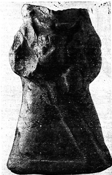
Рис. 2. Статуэтка богини.

Видимо, на мирзакултепских статуэтках запечатлен процесс эволюции образа богини с кубком и известнячным кольцом на стадии перехода от докушанского времени к кушанскому. Различие в одеянии, с одной стороны, очевидно, указывает на усиление в передаче бактрийских богинь местных элементов, а с другой, — на значительные социальные, политические, этнические сдвиги и, следовательно, на изменение идеологических воззрений. Бесспорно, одежда богини из Мирзакултепа местного происхождения и не имеет ничего общего с эллинистической. В последующий, кушанский период образ богини с кубком полностью вытесняется образами богинь в местных одеждах. Среди огромного количества известных нам статуэток кушанского времени пока нет ни одного изображения богини с кубком.