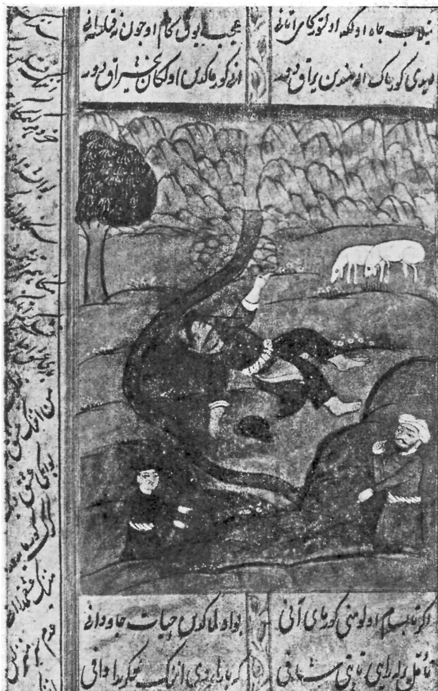
Рис. 1. Смерть Фархада. — «Хамса» А. Навои. Ркп. Института рукописей им. Х. С. Сулейманова АН УзССР, инв. № 23.