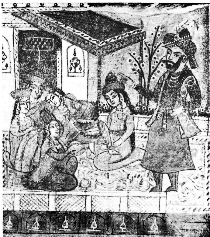
Рис. 2. Разговор Зулейхи с Юсуфом.— «Юсуф и Зулейха» Джамии. Ркп. ИВ АН УзССР, инв. № 5017.

Средневековый стиль миниатюр поздних списков отчетливо про- ступает сквозь скрупулезное соблюдение этикета и тщательное под- черкивание сословной характеристики персонажей. Это те основные мо- менты, которые наряду с сюжетом определяют композиционное по- строение рисунка. Лица высокого сословия помещаются на среднецен- тральном плане, в окружении слуг. Костюмы их богаче и больше оформлены украшениями, чем у других. Иногда они выделяются и бо- лее крупными размерами.