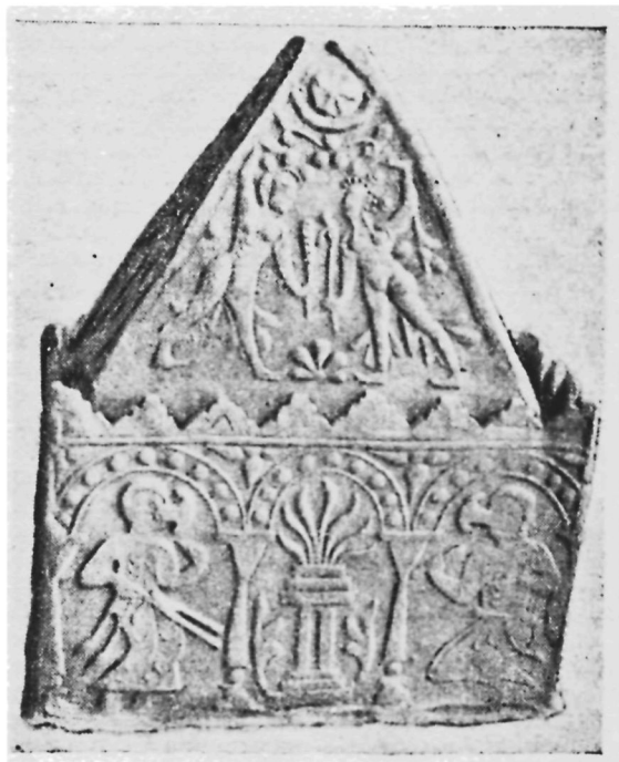
Рис. 1. Общий вид оссуария из Муллакурмана.

Второй оссуарий 2 — прямоугольный (52×25×34 см), с пирамидальной крышкой (46×20×39 см) — сохранился полностью (рис. 1). Он сделан из хорошо обожженной глины, черепок в изломе розовый. Общая высота оссуария с крышкой — 73 см. На внутренней стороне, вверху, выступает полочка для крышки (ш — 2,5 см). По бокам крышки, в нижней части, сделано по одному круглому сквозному отверстию (д=2 см). Все стенки крышки и самого оссуария изготовлены отдельно и соединены между собой при помощи глиняных валиков. Четыре стенки оссуария и крышка украшены рельефными изображениями. Стенки увенчаны ступенчатыми (два-четыре уступа) и треугольными зубцами. Рельефные изображения выполнены оттиском с двух одностворчатых матриц. Одна из них — прямоугольная — использовалась для украшения оссуария, а другая — треугольная — крышки. На узких боковых стенках и крышке оттиснута лишь часть рисунка.