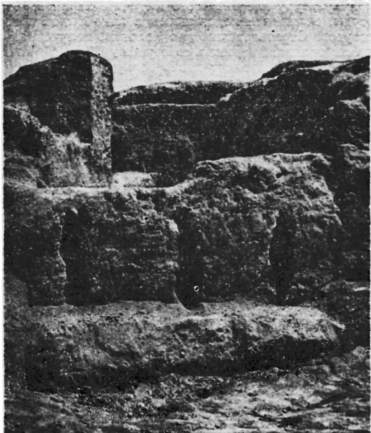
Рис. 2. Городище Шаштепа. Фасад здания II—III вв. до н. э., украшенный стреловидными прорезями.

Строительные приемы: устройство сводчатых коридоров и характер сводов, арки, окна, стреловидные прорезы, примеры окраски интерьеров также заставляют обратиться к кругу памятников последней трети I тыс. до н. э. в низовьях Сырдарьи, включая городища Чирик-Рабат и Бабиш-Мулла.