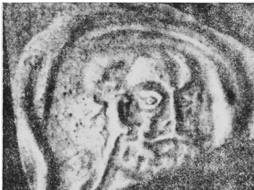
Рис. 2. Тип жителя Ташкента VII—VIII вв. н. э. Оттиск на терракотовой плитке из Актепа Юнусабадского.

В IX в. в регионе постепенно утверждается ислам, но положение его было нестабильно даже в X в. Источники сообщают, что жители Шаша составляли одновременно опору и предмет беспокойства саманидского правительства. Немало сделал для распространения ислама выходец из Шаша шафиитский ученый-богослов Абу Бакр ал-Каффаль ал-Шашин (ум. в 975—977 гг.), могила которого находится в Ташкенте.