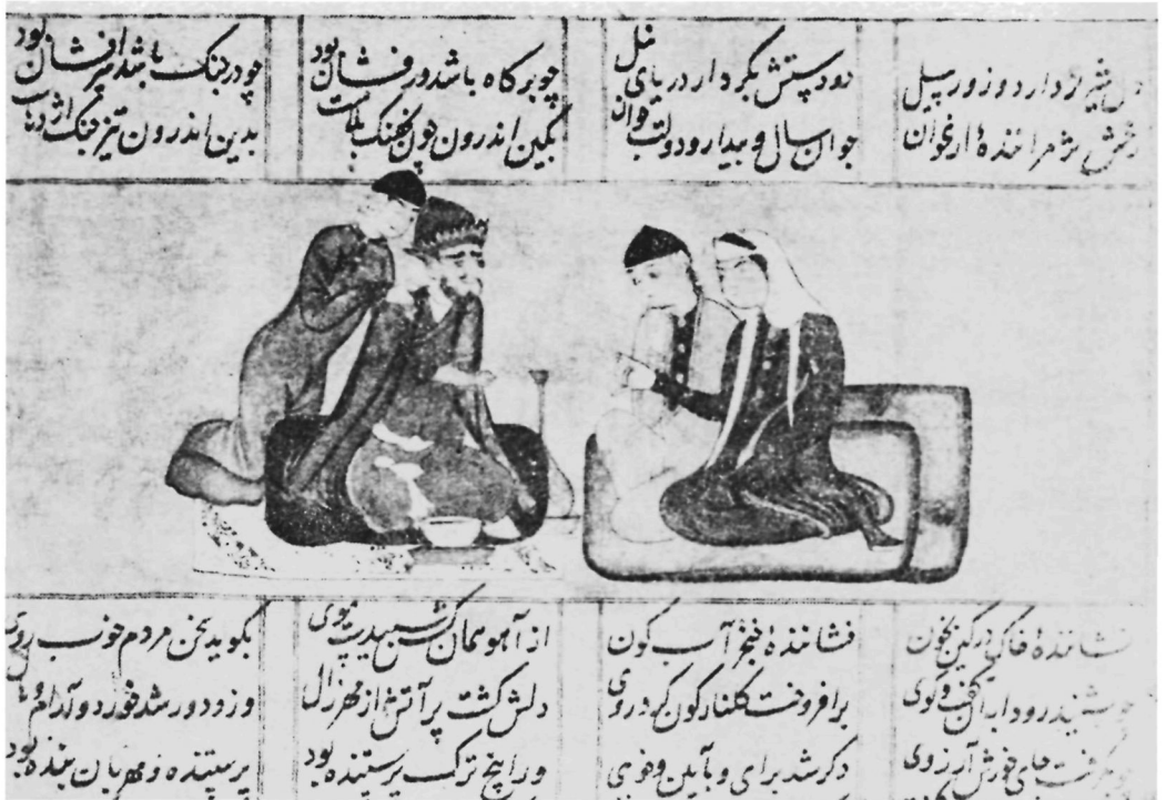
Рис. 1. Мехраб — правитель Кабула рассказывает жене Синдохт и дочери Рудабе о своей встрече с Залем, его красоте, обаянии и храбрости (формат 6×17 см, л. 37б).

Подлинной героикой и мужественностью духа овеяны сцены кровопролитных сражений и поединков, составляющих большую часть изобразительного цикла. В композиционном и изобразительном решении они довольно разнообразны и не повторяются.