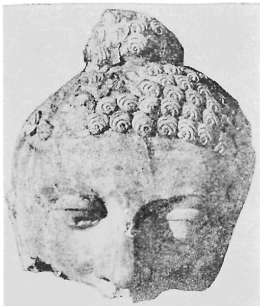
Рис. 2. Голсва Будды (глина).

Фигуру Будды постигла та же участь, что и гипсовые статуи, — голова отсечена от туловища и сброшена в перевернутом виде. Она имеет трещину, нос отбит, несколько волос улиткообразной формы раздавлены. Верхняя часть прически, где волосы собраны в пучок, частично отделилась от головы, руки и плечо отсутствуют. Довольно хорошо сохранились многочисленные складки одежды и накинутый сверху плащ, ноги, стоящие на выложенном из сырцового кирпича постаменте. Все это окрашено в очень яркий красный цвет. Волосы Будды в основе черные, поверх покрыты красным цветом, брови и зрачки также оконтурены красной краской (рис. 2).