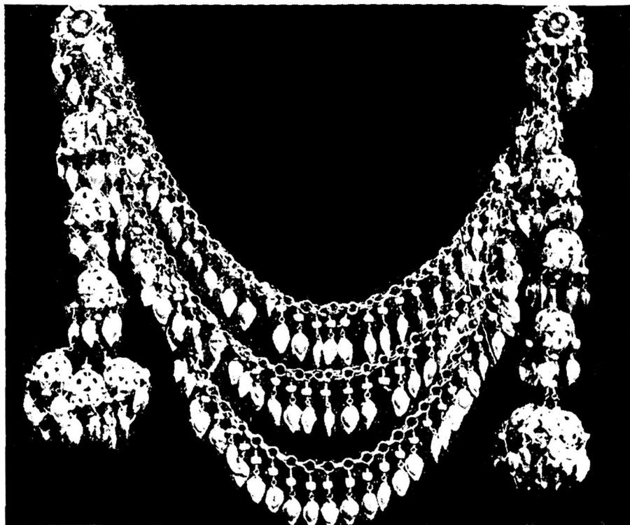
Рис. 1. Шокила. Височно-нашейная деталь. Хорезм, 2-я половина XIX в.

силсила (что в переводе означает «цепочка») в своей оптимальной форме представляла сложный трехчастный ансамбль, состоящий из налобной, височной и подбородочной частей, обрамляющих лицо. Налобная часть, которая накладывалась на головной убор (салля, касаба, шох-бош или пешонобанд), в прошлом предварительно нашивалась на широкую полосу цветного бархата или вышитой ткани и большей частью состояла из двух-трех рядов мелких 6—8-лепестковых серебряных розетт, ажурно скрепленных между собой колечками и цепочками и образующих узорную сетку. Снизу к розеттам подвешивались миниатюрные листики или бодомчики. Эти мотивы создавали ассоциации с венками или головными уборами, сплетенными из растений, которые, очевидно, и лежали в основе художественно-образного решения украшения, иногда дополненного и другими «важными» по значению мотивами, занимающими центральное место в композиции, например солнечные и звездчатые диски, мотив «турна» — «журавли» (БМ, 539—8).