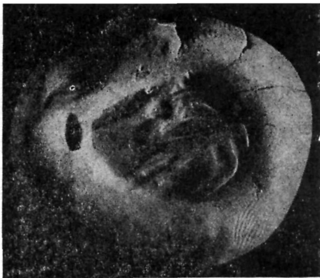
Рис. 2. Оттиск геммы.

Пожалуй, наиболее близки по форме нашей несколько гемм, найденных при раскопках сасанидского памятника Касри Абу Наср в Иране. У них несколько уплощенная и обточенная в виде полуовала верхняя часть, в центре которой — небольшое сквозное отверстие, но щитки во всех случаях круглые и никакого дополнительного оформления верхней части нет 8 . Здесь выделяется группа гемм, с разными изображениями птиц, особенно утки и петуха 9 .