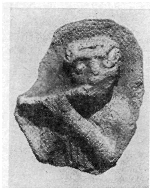
Рис. 2. Музыкант с поперечной флейтой.

Сохранившаяся верхняя часть статуэтки передает изображение юноши с треу-