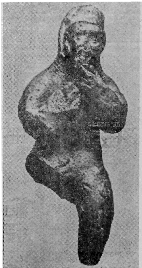
Рис. 1. Музыкант с продольной флейтой.

Однако прямой и самой близкой аналогией по технике изготовления кампыртепинскому флейтисту является найденная на этой же цитадели в коридоре I, в слоях I—II вв. н. э., полностью лепная скульптура нагого бородатого Силена с козьиными ногами 10 . Это сходство допускает возможность их изготовления одним мастером. Тела полностью идентичны, только у флейтиста голова штампованная,