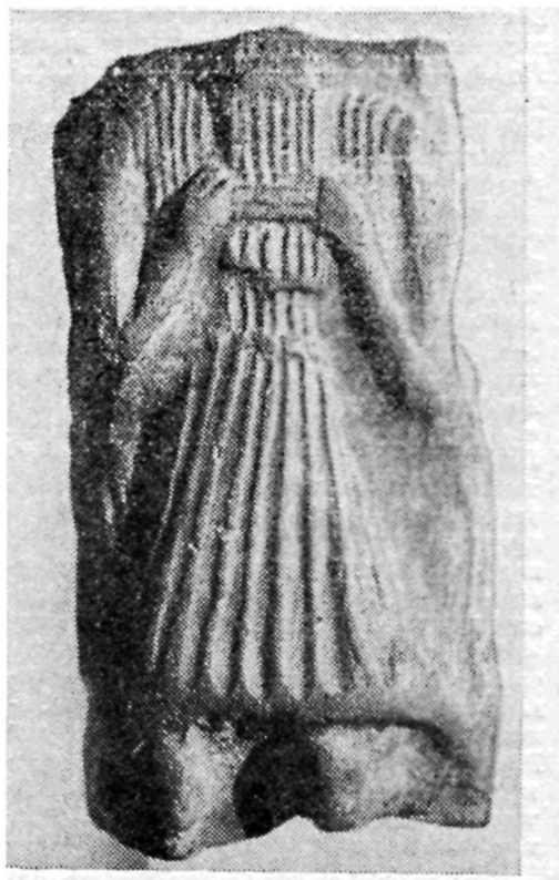
Рис. 3. Музыкант с многоствольной флейтой.

гольным лицом и короткой стрижкой. Волосы, видимо, зачесаны назад и переданы рельефными параллельными линиями. Уши заострены. Брови и нос соединены в виде Т-образной выпуклости. Глаза — круглые налепы, с едва заметным рельефным зрачком (на уцелевшем правом). Под припухлыми, собранными в узелок губами, музыкант держит, направив вправо от себя, поперечную флейту с небольшим наклоном вниз. Руки согнуты в локтях. Кисть левой руки чуть выше правого плеча, повернута ладонью внутрь. Правая рука отставлена вправо и ее кисть, ладонью наружу, находится по уровню немного ниже кисти левой руки. На правой половине груди видны четыре выпуклые параллельные линии, по всей вероятности передающие складки одежды.