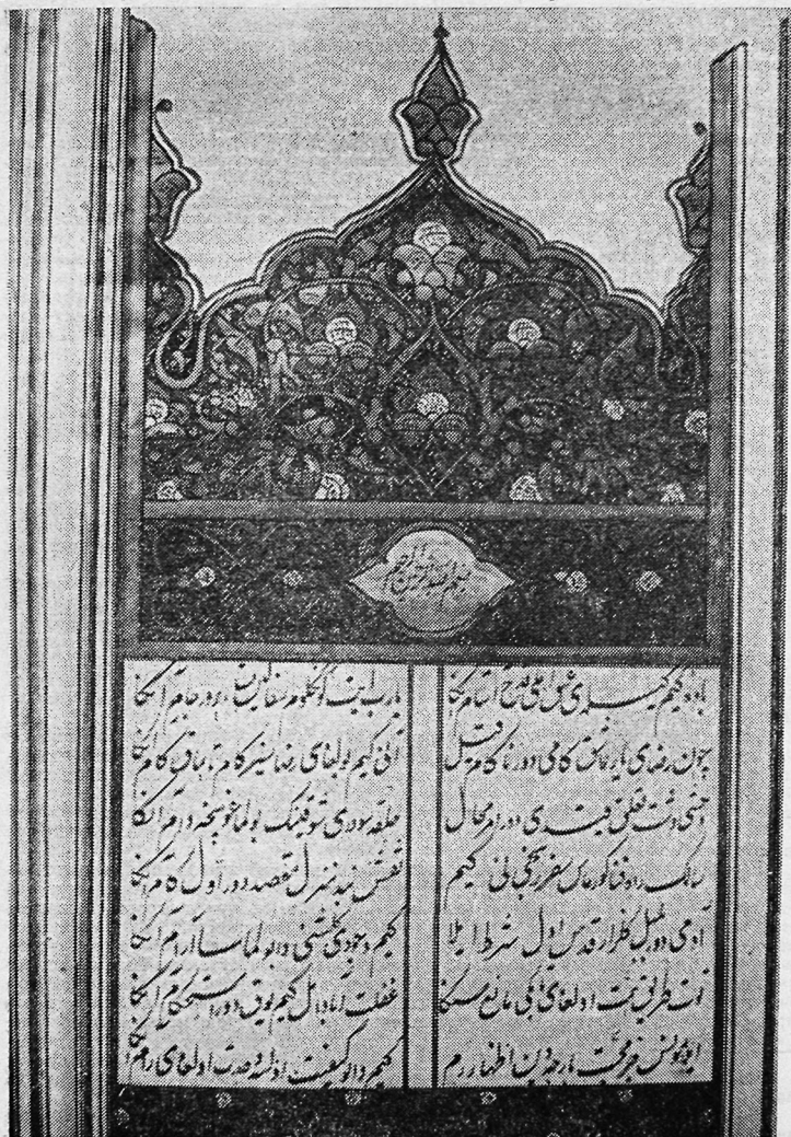
Рис. 3. Ркп. ИВ АН УзССР, инв. № 9356—3650. «Диван» Муниса. Хива. 1881 г. Унван.

Экстравагантный унван рукописи «Диван Муниса» 23 свидетельствует об экспериментальной активности оформительской мысли. Его пластическая форма, композиционное строение, соотношение с текстовой полосой, яркая декоративность, насы-