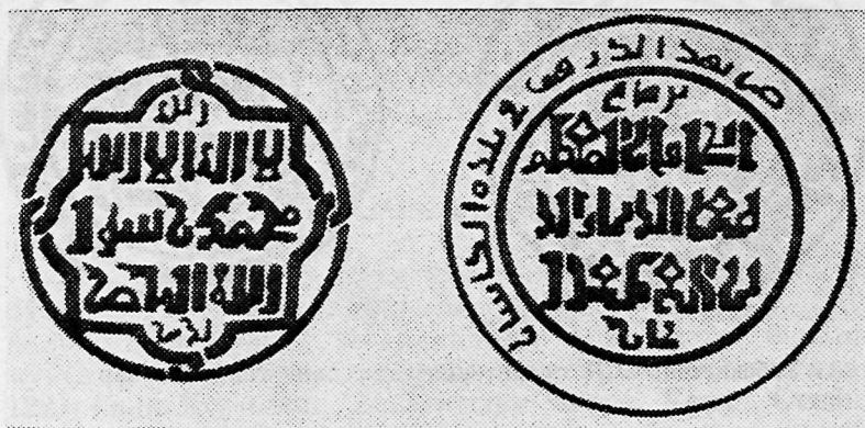
Ўзбекистон ССР территориясидан топилган тангалар

Бундай аҳвол узоққа чўзилиши мумкин эмасди. Савдо-сотив ишлари мўғуллар босиб олган вақтдаги дара-