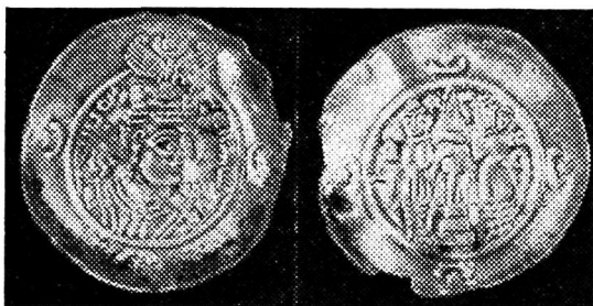
Ўзбекистон ССР территориясидан топилган тангалар

Бухоро областида Ўрта Осиёга кўплаб кириб келган Сосонийлар кумуш тангаси таъсирли роль ўйнаган. Бухорода V асрга келиб бухорхудотлар дирҳами деб аталган танга зарб этила бошланган. Танганинг бир