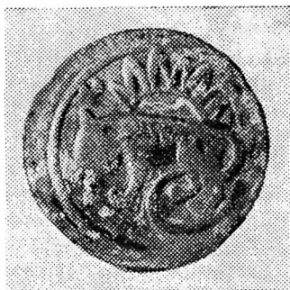
Ўзбекистон ССР территориясидан топилган тангалар

XIII асрга оид Хоразмнинг биринчи дирҳамларида