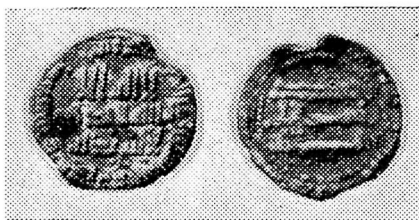
Ўзбекистон ССР территориясидан топилган тангалар

Олтин тангаларга нисбатан аъло сифатли кумушдан кўплаб зарб қилинган тангалар мамлакат ташқари-