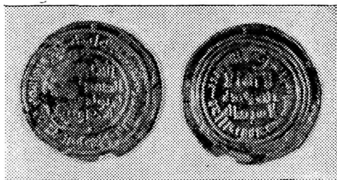
Ўзбекистон ССР территориясидан топилган тангалар

Сомонийлар томонидан зарб қилинган тангалардаги ёзувлар худди халифалик даврида зарб қилинган тангалардек эди. Тўғри, мис ёки кумуш тангаларнинг бир томонида бир ёки икки қатор, аҳён-аҳёнда эса уч қатор ёзувлар учрайди. Дирҳамларда фақат Сомонийлар ноибининг исми ёзилибгина қолмай (гарчанд улар