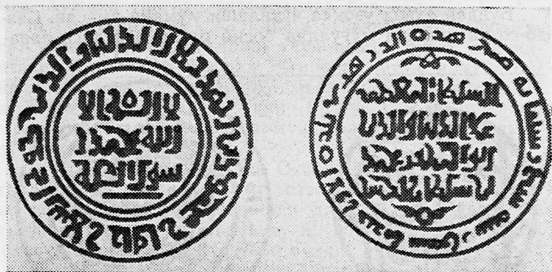
Ўзбекистон ССР территориясидан топилган тангалар

1225 йили Самарқандда зарб қилинган дирҳамлар диққатга сазовордир. Мўғуллар истилосидан кейин ордан беш йил ўтган бўлса ҳам дирҳамларнинг тури жуда ўзига хосдир. Биринчидан, ҳеч қаерда диний ақи-