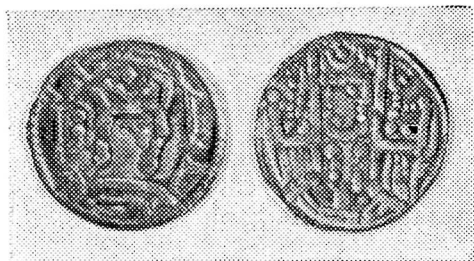
Ўзбекистон ССР территориясидан топилган тангалар

ри — Нух, Аҳмад ва Яҳё халифа Мамунга кўрсатган хизматлари учун Мовароуннаҳрнинг турли областларига ҳоким этиб тайинландилар. Табиийки, халифаликнинг чекка ўлкаларига жойлашган Сомонийлар мустақилликка эришишга ҳаракат қилганлар. Улар Тоҳирийлар сулоласи тахтдан туширилгандан кейингина мустақилликка эга бўлганлар. Улар Сомонхудоғнинг чевараси Исмоил ибн Аҳмад ҳукмронлик қилган вақтда мустақилликка эришдилар. Исмоил ибн Аҳмад қисқа муд-