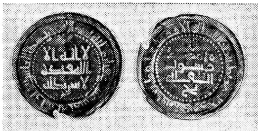
Ўзбекистон ССР территориясидан топилган тангалар

Сомонийлар даврида зарб қилинган мис тангалар ташқи кўриниши билан ҳам диққатга сазовордир. Мис танга энг кўп тарқалган, кўп муомалада бўладиган