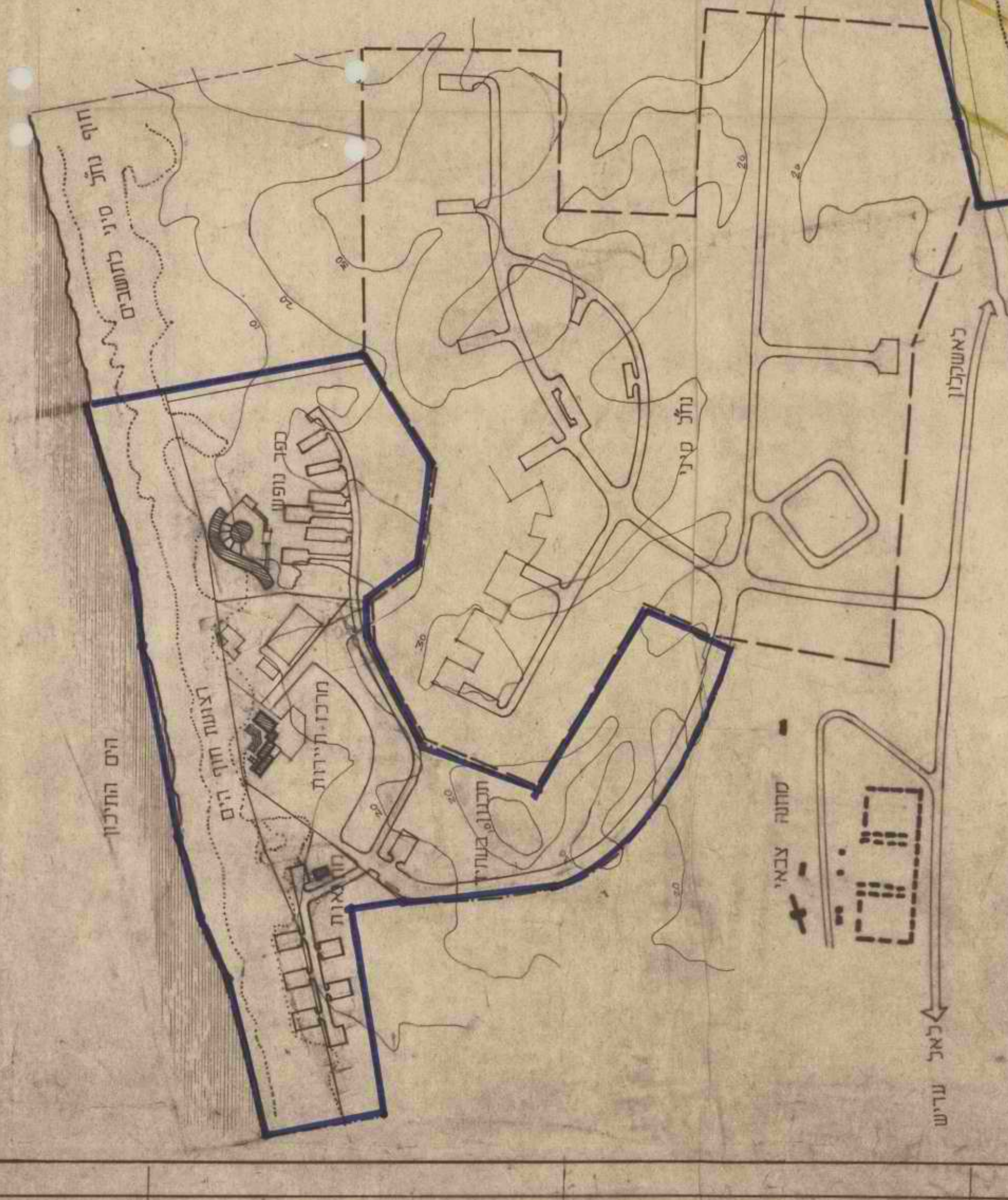
תכנית יעוד שטחים טכנית יעוד שטחים