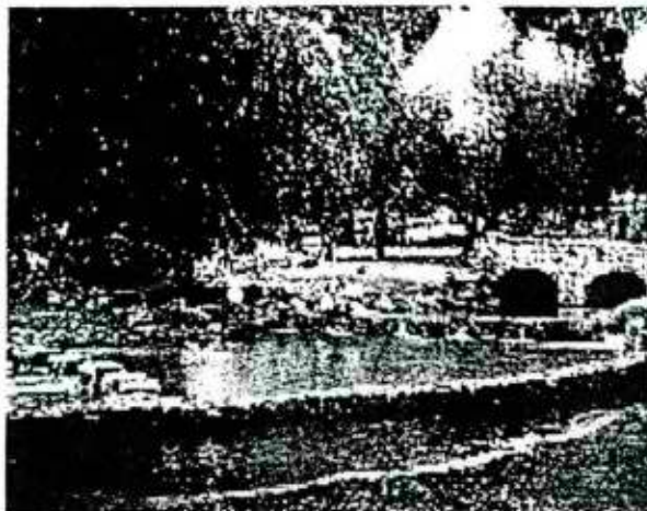
אי ירוק בתוך ים שחור. פארק הירדן

החל מאפריל ועד סוף אוקטובר פועל במקום "אבו קייק", שיט קיאקים אבובים וסירות משפחיות איתן אפשר לנוע בתוך הנהר הכי משמעותי שלנו, ואולי גם להיחקק באיזה נזע שנלש מעץ סורר.