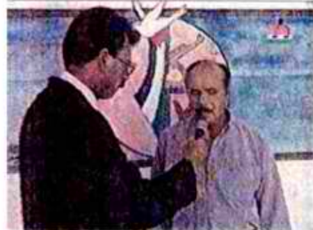
המפה נבחרת כרקע לשידורים וראיונות