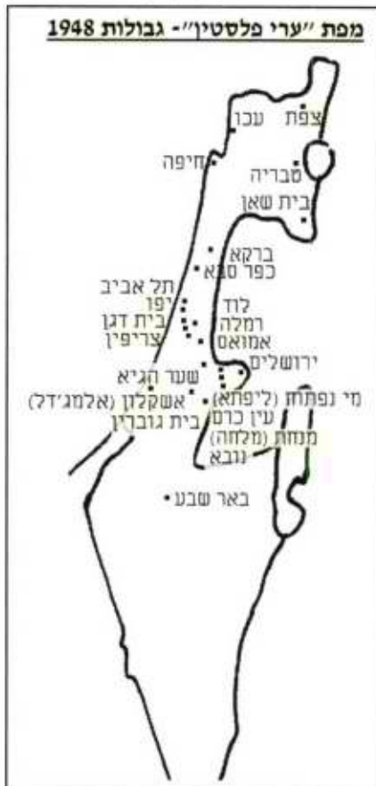
מפה מס' 2

1. אגודת הצדקה בני יפו בשכם מארגנת ... את הכנס "יפו כלת הים" ... בחסות הנשיא יאסר ערפאת. [אלקדס, 9 ביולי 1998]