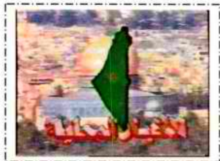
המפה בפתיחת החדשות היומיות ובסיומן

אי ההכרה בישראל באה לידי ביטוי בולט בהימנעות מהצגת מדינת ישראל במפות. המפה היחידה של "פלסטין" המופיעה בטלוויזיה ובחינוך הפלסטיני, כוללת את כל שטחי ישראל.