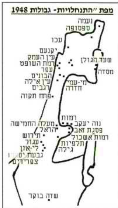
מפה מס' 1