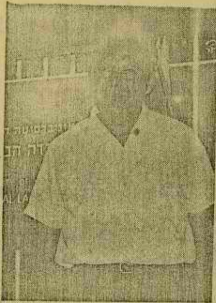
ראש עיריית אילת אשר אזר

מערכת טלפון, בכל בית יש מיזוג אוויר מתאים, ותכני בית הנסיעות, המדרכות ומגרשי החניה מתאמה לקצב התקדמות הבניה, כאן הירות הגדולות ביותר שנבנו עד כה בעיר עלידו מסבד השיכון, גם רמת הבניה, התכנון הפנימי והחיצוני גבוהה בהרבה מבשכונות האחרות בעיר. לאימכבר טובים עם משרד השיכון על פרסום תחרות לתכנון שכונה נוספת ברומה של העיר, ומה יצתה, לפי המקוה, טובי התכנונים בארץ, נוסף על כך