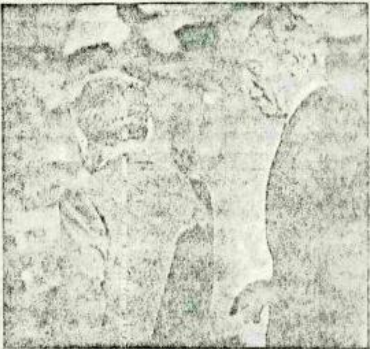
ג'ורג' ראשיהממשלה ושר האוצר, שמעון פרס, מלווה את ראשיהממשלה יצחק שמיר למטוס, בצאתו למסעו באירופה.

ראשיהממשלה יצא לביקורים בבריטניה ובספרד • הערכות בבריטניה: השיחות עם תאצ'ר יתנהלו באווירה נוקשה • רבין בארה"ב: „צעדי צה"ל בעזה לא נועדו להפעיל לחץ על הפלשתינים" • ארנס בארה"ב: „אנו זקוקים לתמיכה האמריקנית, ולדעתנו - זכאים לה"