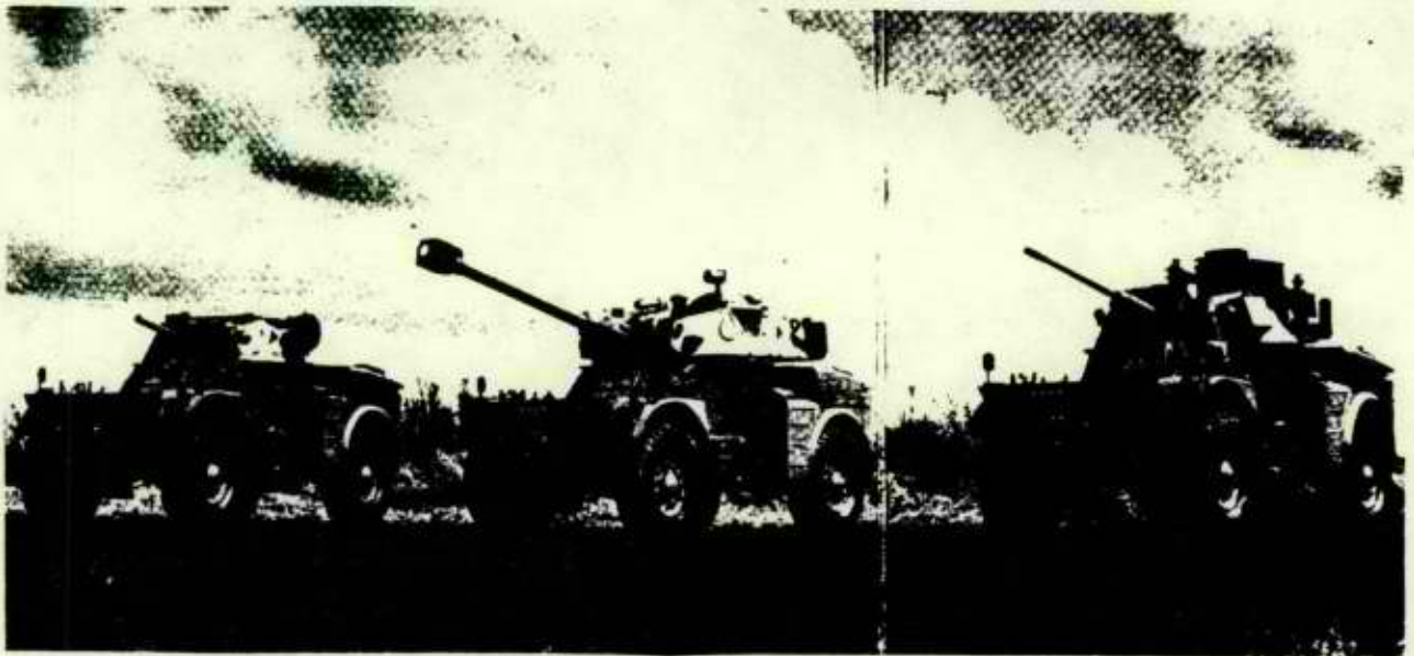
From France: Eland light armoured car family—left to right—60 mm mortar, 90 mm gun and 20 mm cannon.

maintenance". And an observer at Waterkloof Air Base, near Pretoria, reported that apparently South African maintenance is rather good, "with 10 to 20 year old aircraft looking as if they had just been built". 31 Yet however well one maintains an aircraft, one still needs spare parts and, as was reported above, the French stopped the parts flow in 1977. The apparent answer was published in the 29 October 1981 edition of the London Times : Israeli technicians are performing high-level maintenance (presumably depot maintenance) on South African aircraft using parts originally supplied by the French to the Israelis for Israeli aircraft and not intended for resale.