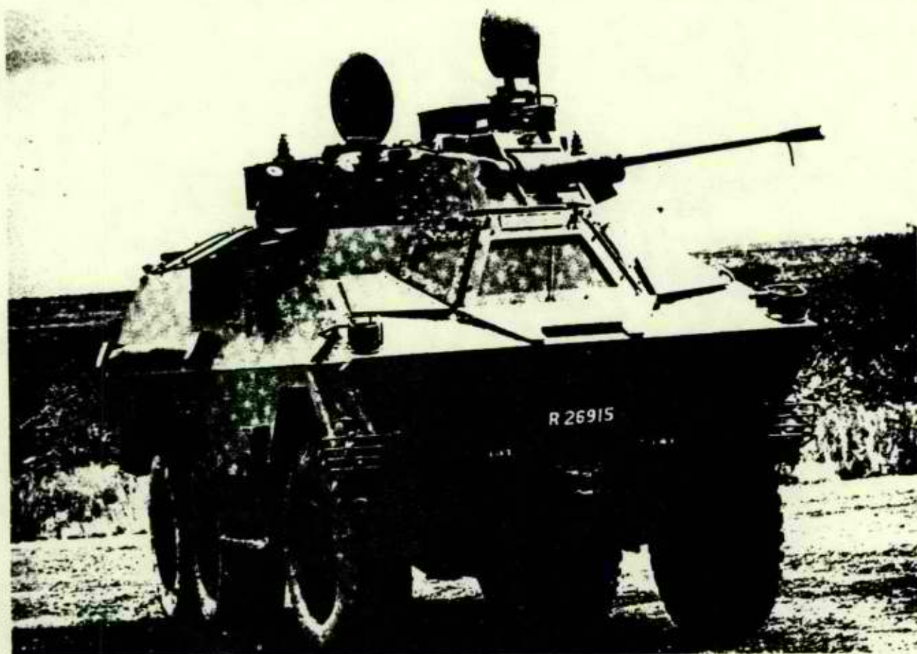
Ratel 20 IFV

A sign of the growing sophistication of the South African defence industry is the appearance of locally designed or modified equipment comparable to that found elsewhere in the world. The Sandock-Austral company, which built the Eland armoured car (which proved quite popular with South African troops and was reputed to be able successfully to engage Angolan and Cuban tanks) has taken its experience with the Eland to produce a six-wheeled infantry fighting vehicle called Ratel. ARMSCOR took the G-5 gun-howitzer and designed a wheeled