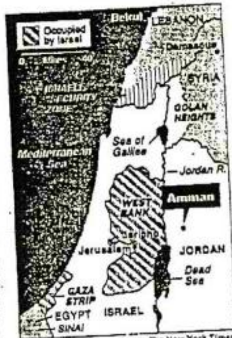
The New York Times Amman must reappraise Jordan's relationship with the Palestinians.

And, in essence, the King who has guided his land through war and upheaval throughout his reign must now undertake his most fundamental reappraisal of his relationship with the 1.7 million Palestinians who populate both the embryonic Palestine of the still-occupied West Bank of the River Jordan, and the more than two million Palestinians who form two-thirds of his own population of the East Bank.