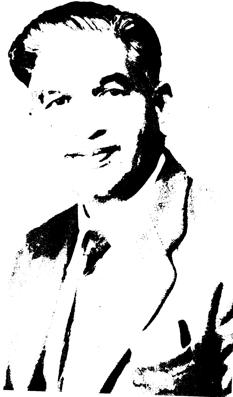
डॉ. रामकुमार वर्मा

जन्म : 15 सितम्बर, 1904 निधन : 5 अक्टूबर, 1990