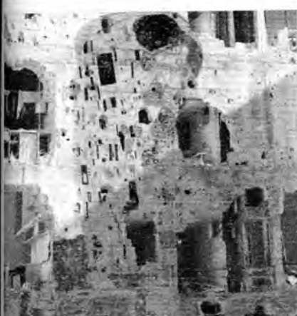
ਸ਼ੀਰੀਆ ਵਿੱਚ ਹੋਈ ਤਬਾਹੀ ਦੇ ਉੱਤੇ ਕੰਧ-ਕਲਾ !

ਮੁੱਖ ਸਫਾ : ਅਰੁਣਾਚਲ ਪ੍ਰਦੇਸ਼ ਵਿੱਚ ਚੱਲ ਰਹੀ ਰਸਨਾ-ਪਾਰਟੀ