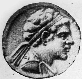
Евкратид II тангасининг олд томони.