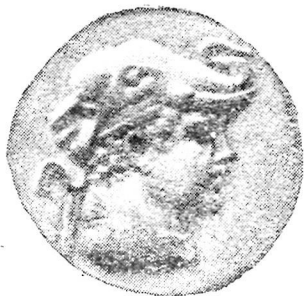
а. Деметрий тангасининг олд (а) ва орқа (б) томони.