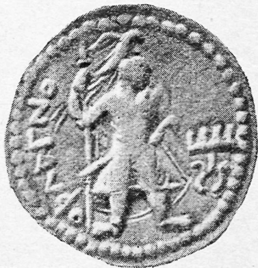
Канишка ва Хувишка тангаларининг орқа томони.