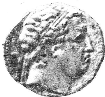
Евтидем тангасининг олд томони.