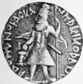
Канишка тангасининг олд томони