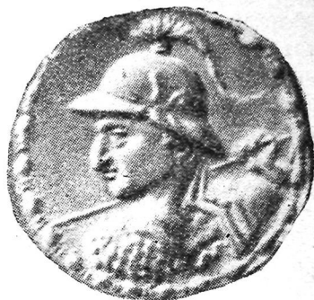
Архебия тангасининг олд томони.