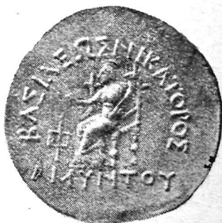
Аминтас тангаларининг орқа томони.