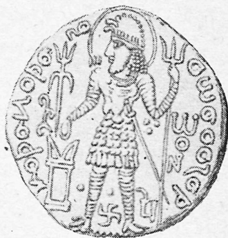
Васудева тангасининг олд томони.