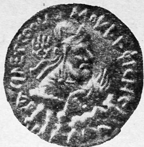
Вима Кадфиз тангасининг олд томони