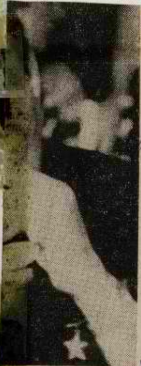
מנהיג בריח"ט יואניד עם ראש ממשלת בריטניה

הכתב מציין כי ד"ר קסינג'ר הביט באוזן מנהיגי ישראל ספק אם תוכן סועל לטובתה. ככה זמן תוכל ארה"ב לתמוך בה בלי תנאי, כאשר הפולם הערבי הגדול העשיר, המשפיע גם על אירופה ויפאן, מוחה עליה פשו רה ז