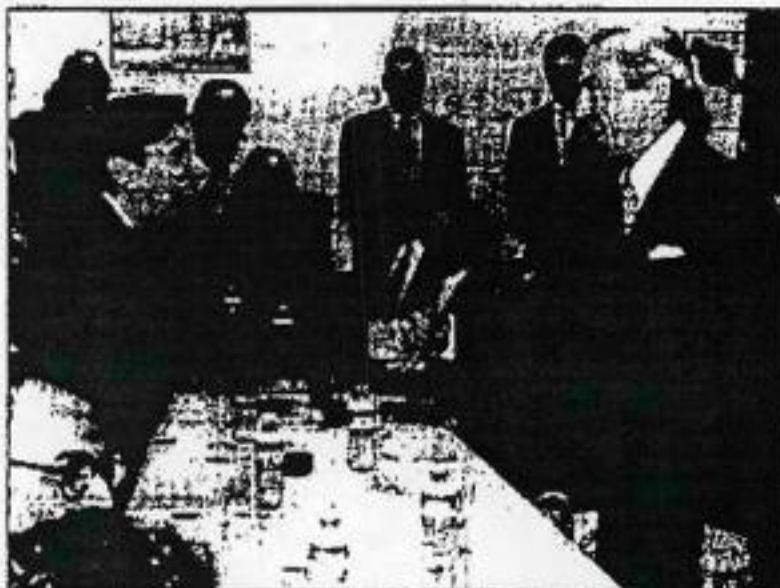
IN JERUSALEM: Secretary of State Warren Christopher meets with Palestinian Hanan Ashrawi, who said there was a 'head-on collision' on major issues.

"We cannot permit the Serbs to commit such humanitarian gross conduct that we have all witnessed,"