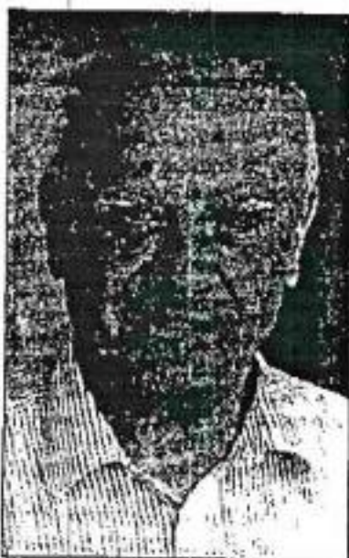
HAIDAR ABDEL SHAFI ... seeks radical reform of PLO

In the new letter, Abdel Shafi used cautious words, but his message was much more blunt: The Palestinians squandered their time.