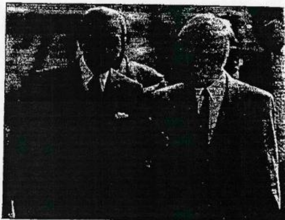
Israeli Foreign Minister Peres, right, chats with Christopher, who began discussions toward finding areas of agreement between Israel and Palestinians. Today he meets with Syrian President Assad and he is to wind up his trip Thursday after more talks in Israel.

The Israeli-Palestinian negotiating track has been hamstrung over Palestinian insistence that talks about limited self-government for the West Bank and Gaza Strip be broadened to include East Jerusalem, which Israel captured from the Arabs in the 1967 war. There also is a major disagreement about the nature of an autonomy system. The Palestinians seek to define a specific geographic area that would be covered and