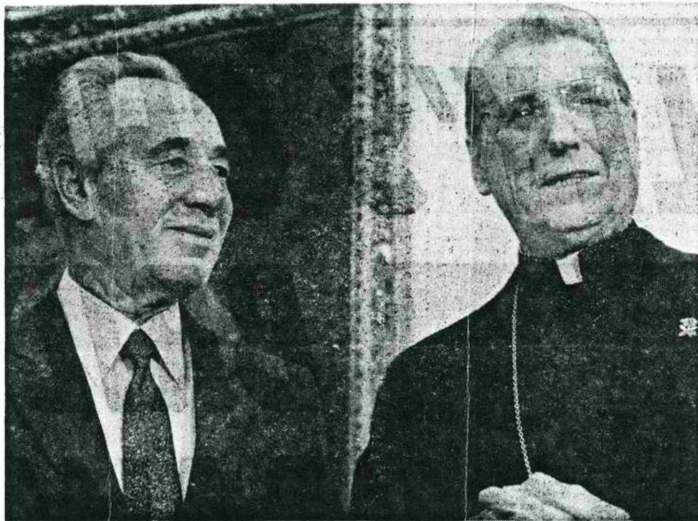
New York Post: Louis Lictor

However, he said these positive signals are often confused by other actions, such as the jailing of Jews who want to leave the Soviet Union.