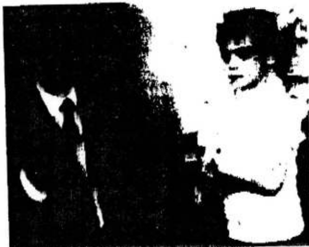
Saddam Hussein in a videotaped meeting with a young hostage.

During 1990, and particularly after 2 August, the press reported increasing movement of terrorists to Baghdad, signalling the deepening relationship between these groups and Iraq. Even before the invasion of Kuwait, Iraq provided safehaven, training, and other support to Palestinian groups with a history of terrorist actions. The Arab Liberation Front (ALF) and Abu Abbas's PLF, responsible