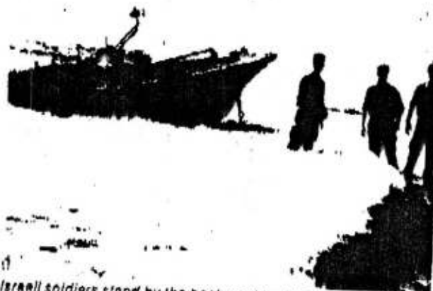
Israeli soldiers stand by the boat used by PLF terrorists to attack the beach at Tel Aviv.